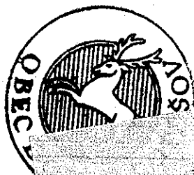
I. ...retušík starosta obce Dolný Lopašov